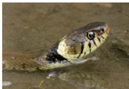
Couleuvre à collier

Il est DIFFICILE DE CONFONDRE CETTE ESPÈCE avec une autre. Toutefois, l'Orvet fragile (Lézard) est également présent sur le territoire. C'est un lézard sans pattes qui peut donc ressembler à un serpent mais ses écailles sont très petites et sa couleur est marron uniforme.